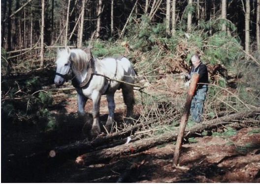
Paarden aan het werk